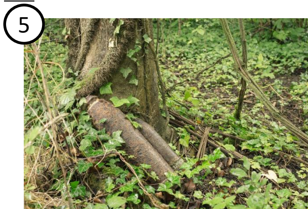
Obus dans la forêt de Craonne.