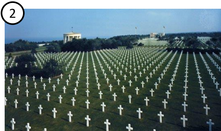
Cimetière américain de Colleville (Normandie)