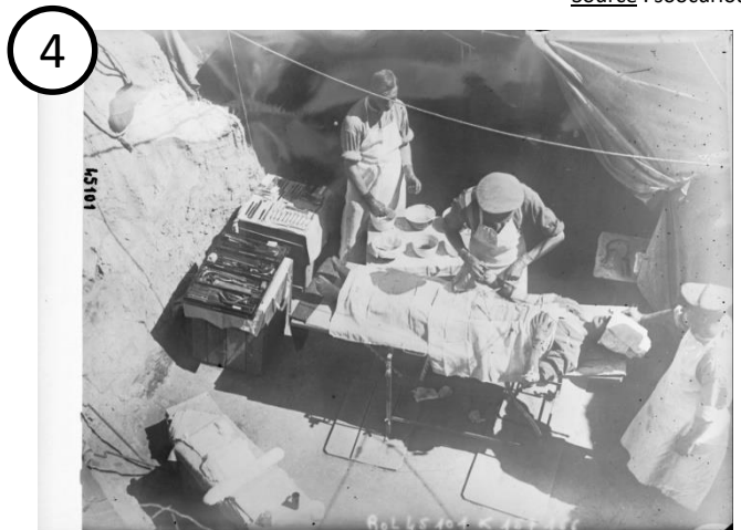
Aux Dardanelles, dans une ambulance, un chirurgien au travail