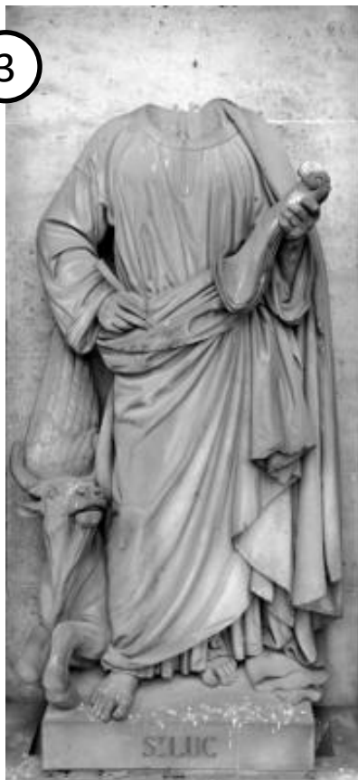
Arrière de l'église de la Madeleine, statue de Saint Luc