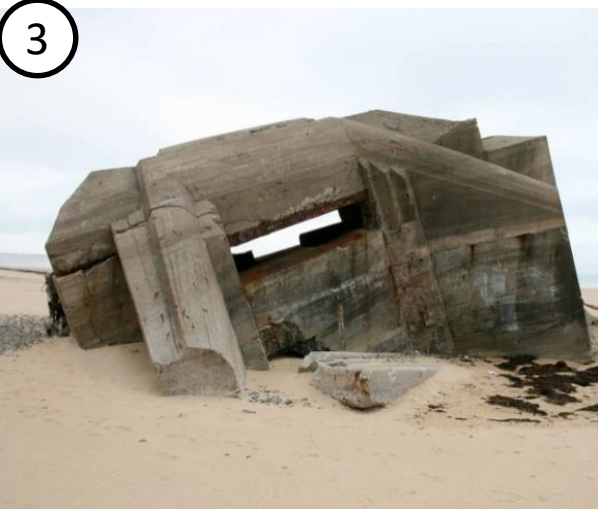
Blockhaus enseveli dans le sable