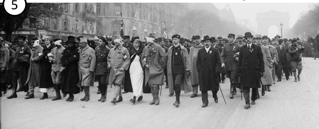
Défilé des blessés lors du 11 novembre 1918