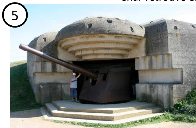
Restes d'un canon et d'un poste de défense