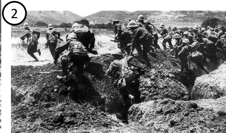
Des soldats sortant de la tranchée