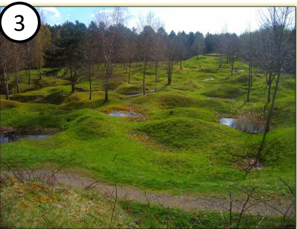
Champ de bataille de 1914