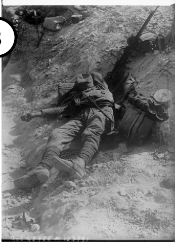
Soldat dormant dans une tranchée