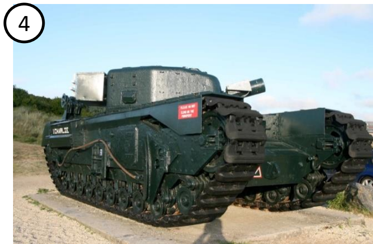
Char retrouvé enseveli sous 4m de terre