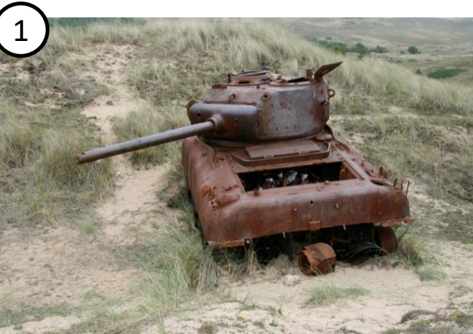
Vestige de char

Observe les documents suivants puis réponds aux questions, que tu utiliseras pour rédiger un texte de présentation à tes camarades.