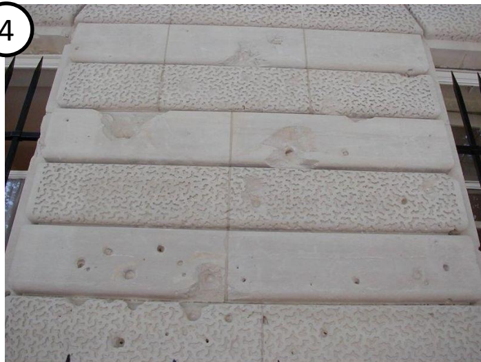
Hôtel de Brienne