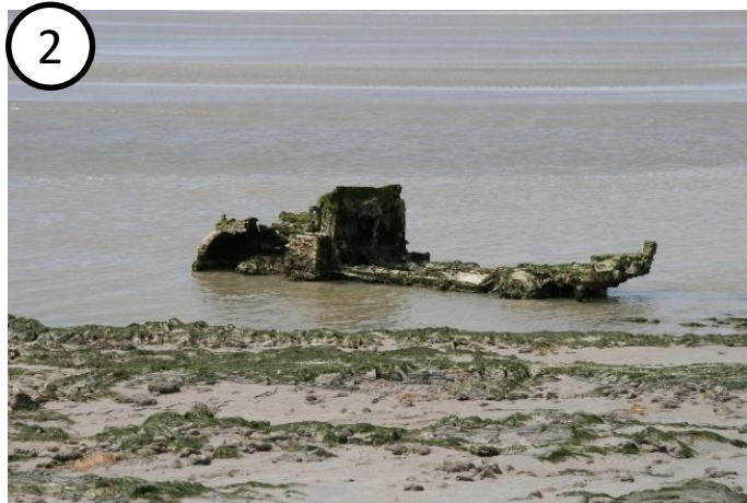
Vestige de camion allemand ensablé