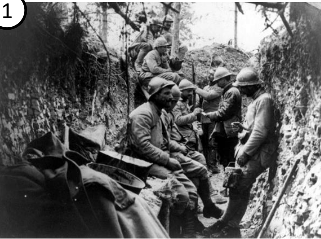
Scène de tranchée

Observe les documents suivants puis réponds aux questions, que tu utiliseras pour rédiger un texte de présentation à tes camarades.