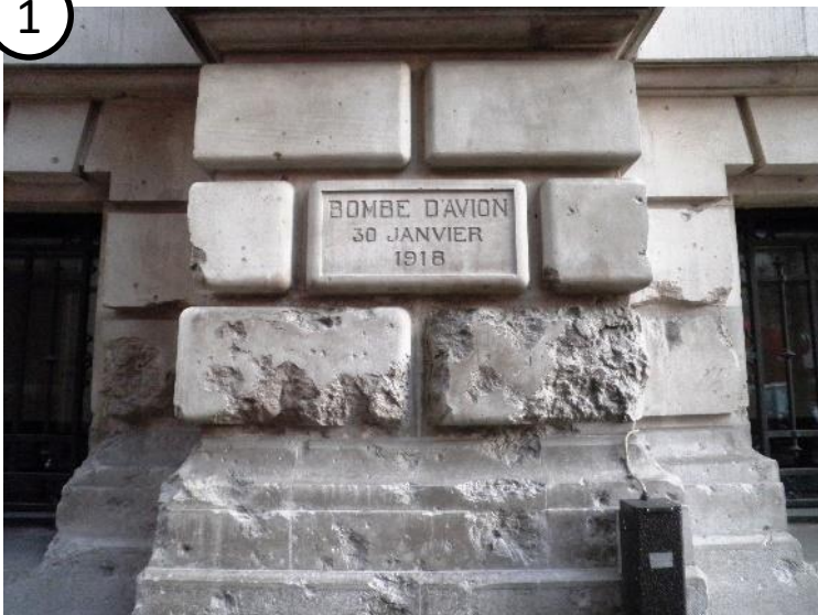
Immeuble Le Centorial (côté rue du Choiseul)