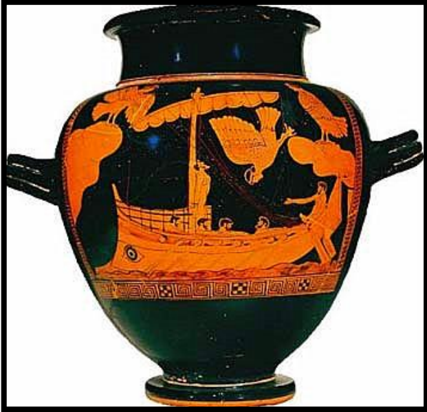
Ulysse et les Sirènes, Vème s. av. J.C