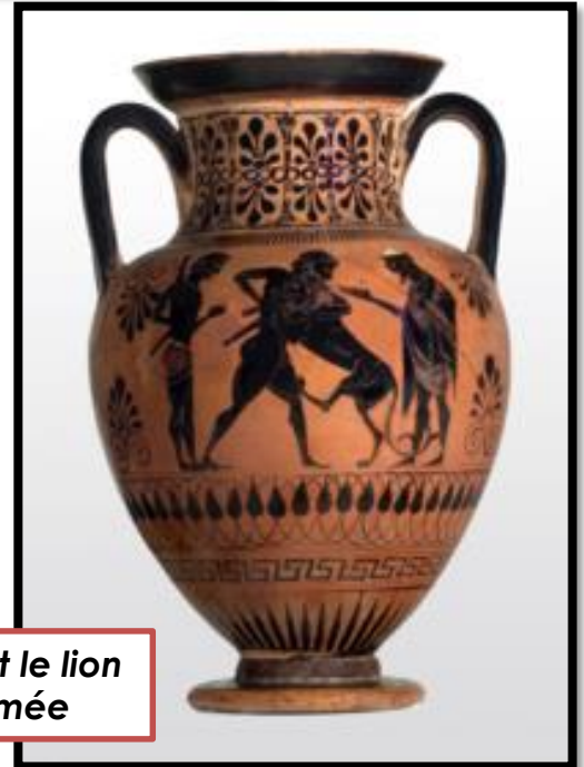
Hercule et le lion de Némée