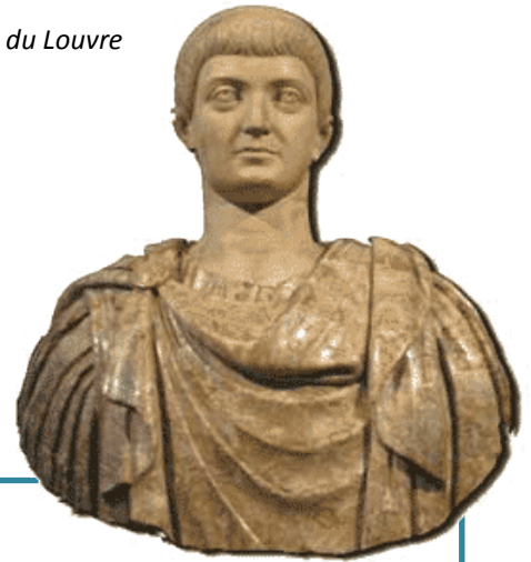
Constantin, musée du Louvre