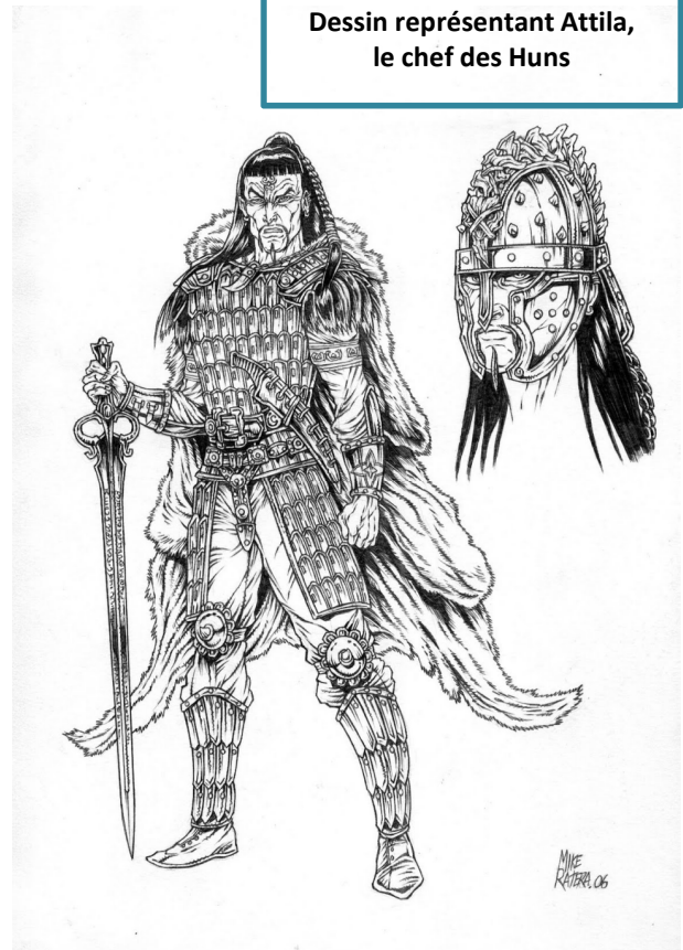
Dessin représentant Attila, le chef des Huns