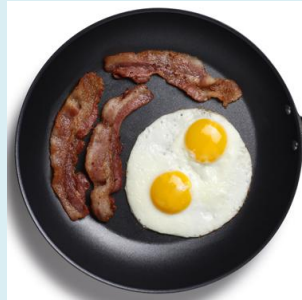
Le déjeuner, entre midi et 1h30 :